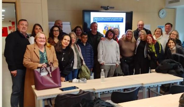
Charlas al personal del Ayuntamiento de Madrid